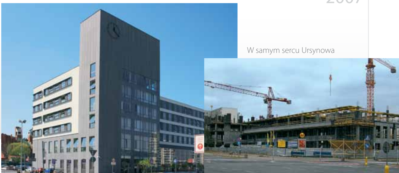
W samym sercu Ursynowa