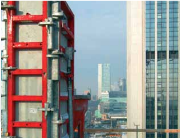
Wzorcową powierzchnią betonową