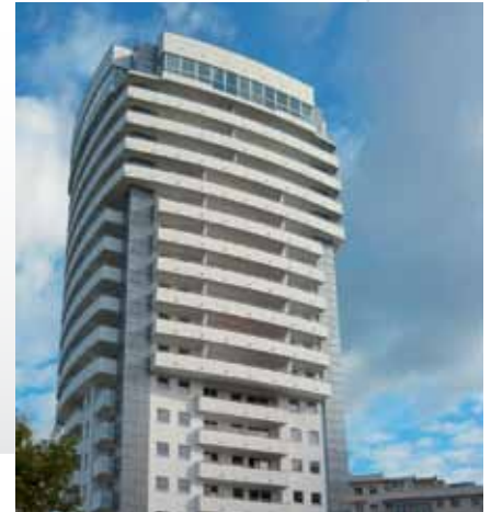
Najwyższy apartamentowiec w mieście