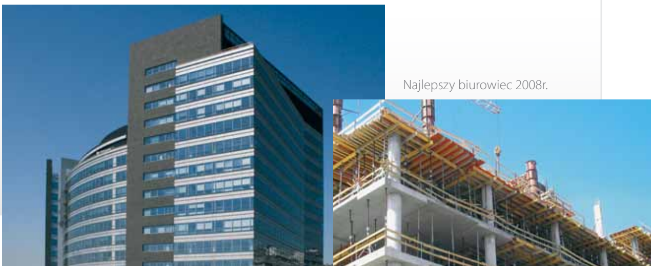
Najlepszy biurowiec 2008r.