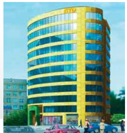
Prestiżowy biurowiec w centrum Mokotowa