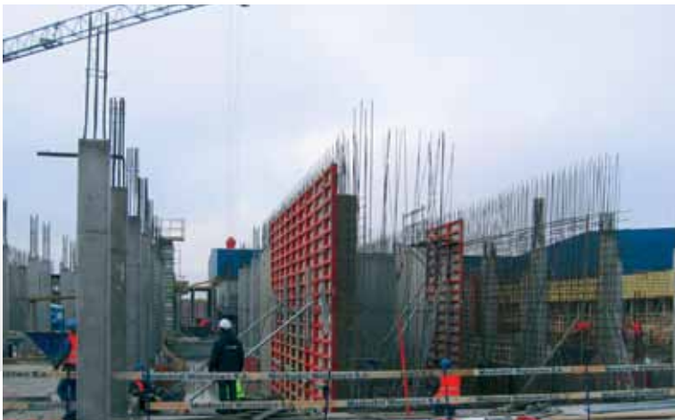
Ponad 15-metrowe ściany żelbetowe