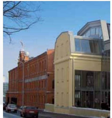
Najlepsze Centrum Handlowe Europy Środkowo - Wschodniej 2008