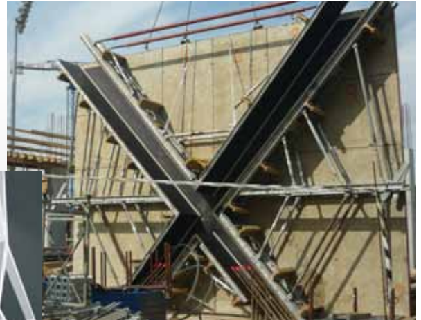
Największy obiekt sportowy we Wschodniej Polsce