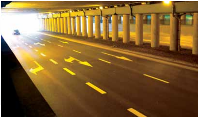
Pierwsza inwestycja modernizująca obwodnicę miasta