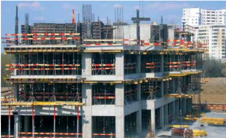
Jedenaście budynków, 1585 mieszkań na 6,5 ha działce