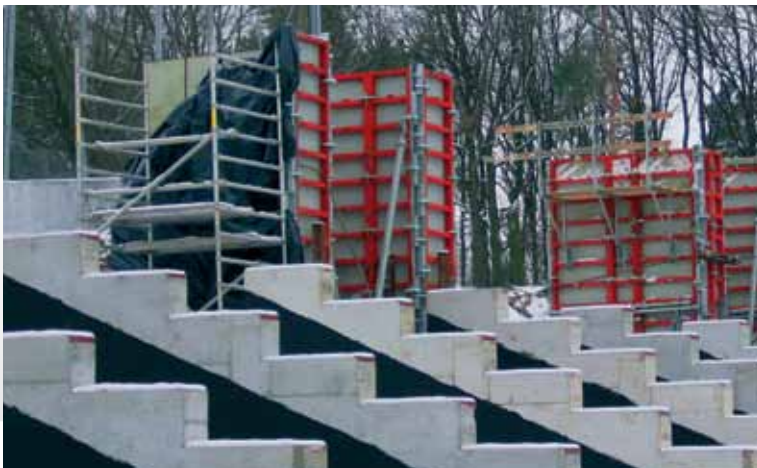
Obiekt na EURO 2012