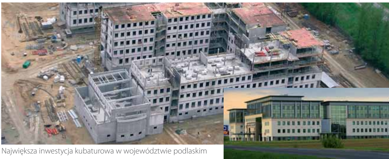
Największa inwestycja kubaturowa w województwie podlaskim